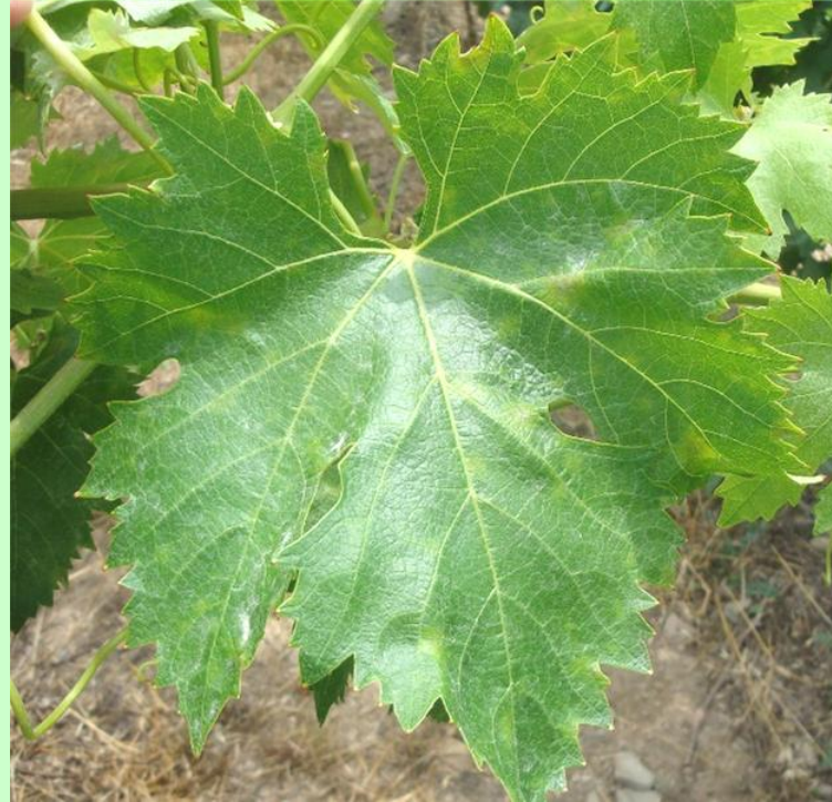
OIDIO MALVASIA NERA