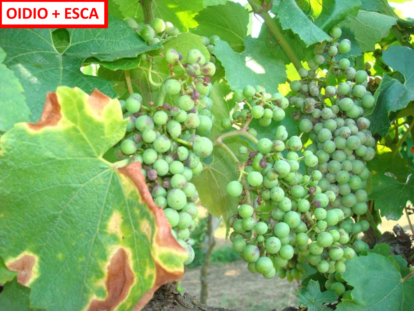
OIDIO + ESCA