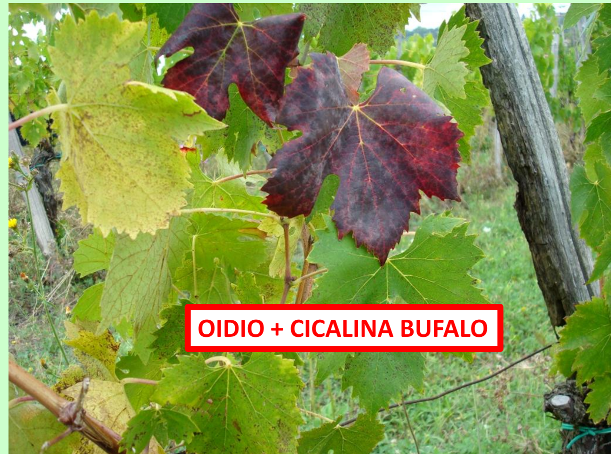
OIDIO + CICALINA BUFALO