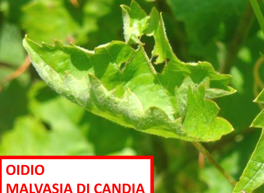
OIDIO MALVASIA DI CANDIA